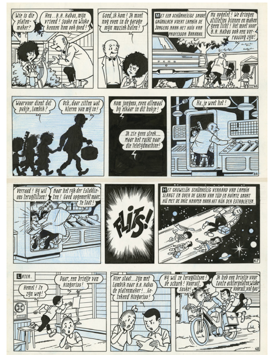
De kale kapper - Suske en Wiske, deel 122, 1971 Chinese inkt op papier, 41,1 x 29,4 cm