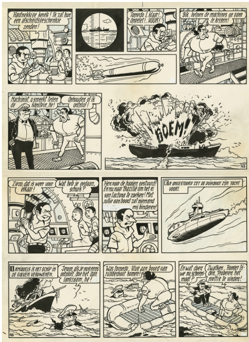
Het zoemende ei - Suske en Wiske, deel 73, 1967 Chinese inkt op papier, 41 x 29,6 cm

In hun 75-jarig bestaan hebben Suske en Wiske niet alleen miljoenen lezers enthousiast gemaakt, maar deze papieren personages zijn ook ware iconen van de Lage Landen geworden. Alle eer gaat naar hun schepper, Willy Vandersteen, die in ware vlagen creativiteit de lat hoog legde om voor elk avontuur een stevig kader vast te leggen als referentiepunt voor de lezer, terwijl hij oneindig varieerde bij de thema's die hij aansneed.