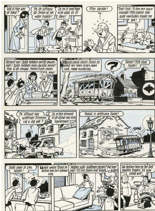
Wattman - Suske en Wiske, deel 71, 1967 Chinese inkt op papier, 40,8 x 29,8 cm