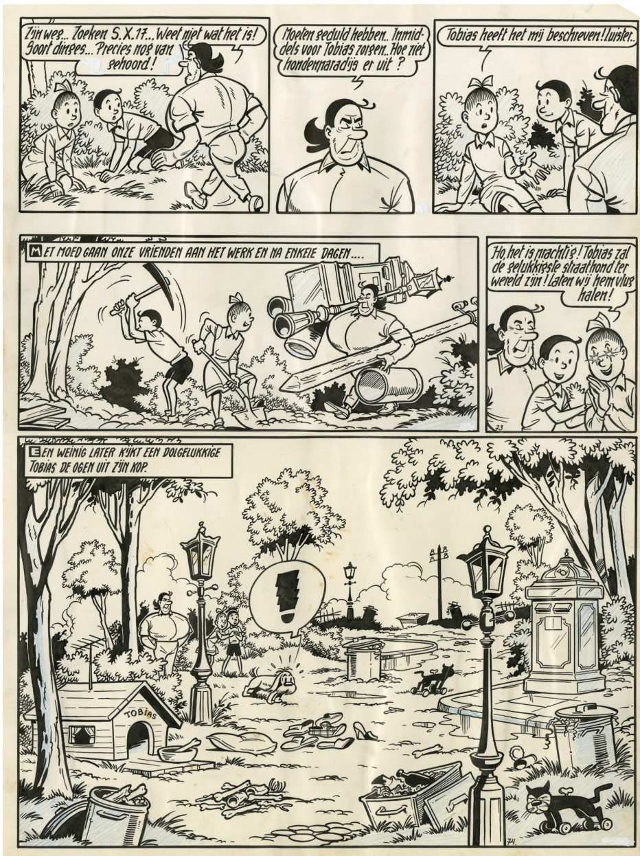
Het hondenparadijs - Suske en Wiske, deel 98, 1969 Chinese inkt op papier, 42,5 x 29,8 cm