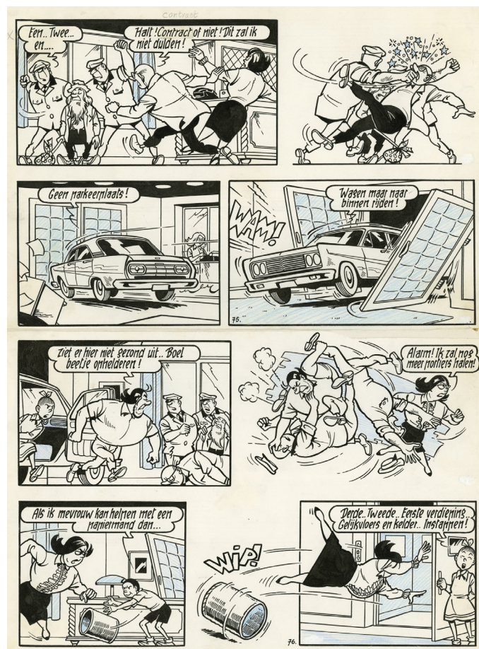
De Poenschepper - Suske en Wiske, deel 67, 1967 Chinese inkt op papier, 40,9 x 29,7 cm

Kom vanaf 4 februari tot 20 maart op ontdekkingstocht en blader met nostalgie door mythische pagina's vol humor, avontuur en fantasie.