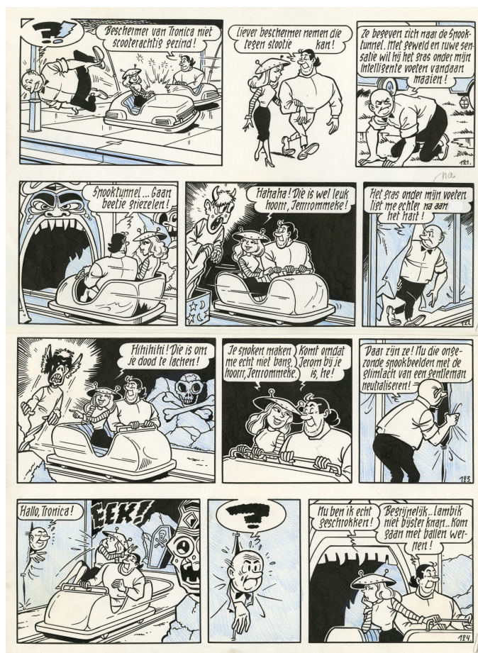
Tedere tronica - Suske en Wiske, deel 86, 1968 Chinese inkt op papier, 40,3 x 29,8 cm

Willy Vandersteen is een slimme zakenman, maar hij blijft vooral een van de meest productieve en inventieve auteurs van het Vlaamse beeldverhaal. Unesco beschouwt hem als de op één na meest vertaalde Nederlandstalige schrijver. Hij wordt in Vlaanderen meermaals bekroond en krijgt ook prijzen voor Franse vertalingen van zijn strips. Het festival van Angoulême geeft hem in 1977 de prijs voor beste buitenlandse scenarist en datzelfde jaar krijgt hij een Sint-Michielsalumprijs. Na zijn dood prijkt zijn naam opnieuw op een album dat in 2007 een Sint-Michielsprijs wint. Zoals hij zelf wou, overleven zijn personages hem en beleven ze nog steeds avonturen vol geschiedenis, fantasie en humor, met respect voor zijn grenzeloze creativiteit.